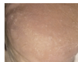
Haut ist elastisch und intakt