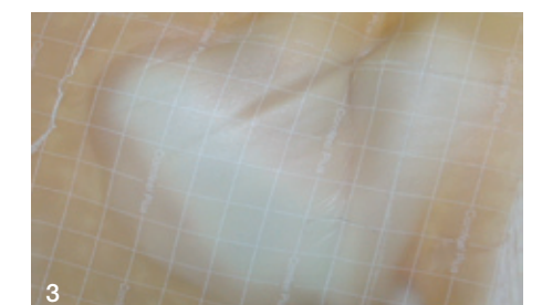
3 Comfeel Plus Flexibel nimmt überschüssige Feuchtigkeit auf und bildet eine Gelblase