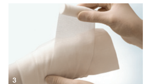
3 Fixierung des Verbandes mit einer Mullbinde