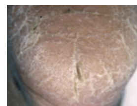
sehr trockene, rissige Haut