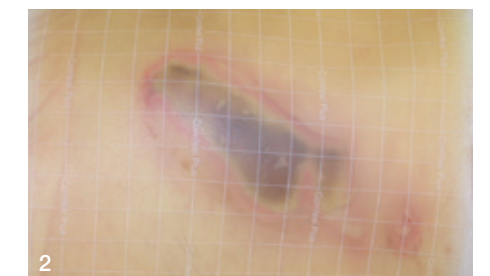
2 Hier beginnt das autolytische Débridement. Sekundärverband: Comfeel Plus Flexibel