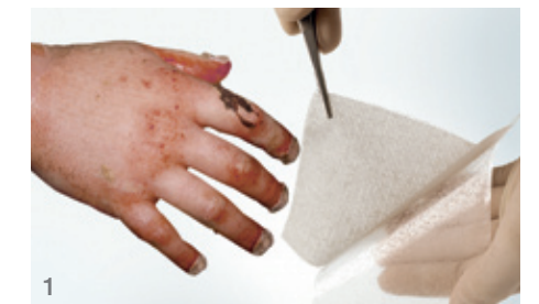
1 Entfernen des Schutzpapiers