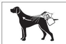
2 Entgegen dem Haarstrich sprayen, Tier dabei festhalten