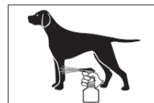
5 Kleiner Sprühstrahl für Pfoten und Hautfalten beim stehenden Tier 6 Für den Kopf die Lösung auf einen Handschuh geben