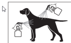
3 Großer Sprühstrahl auf Rücken und Seiten beim stehenden Tier