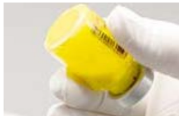
Suspendiert: keine Klumpen