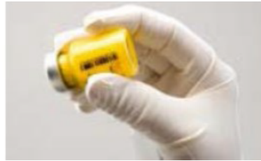
Abbildung C: Energisches Schütteln der Durchstechflasche

Wenn sich Schaum bildet, lassen Sie die Durchstechflasche stehen, bis der Schaum verschwindet. Wenn das Arzneimittel nicht unmittelbar verwendet wird, muss es zum Resuspendieren energisch geschüttelt werden. Zubereitetes ZYPADHERA ist bis zu 24 Stunden in der Durchstechflasche stabil.