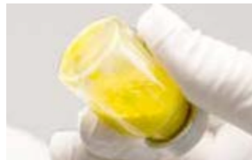
Nicht suspendiert: sichtbare Klumpen