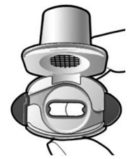
Kontrolle, ob die Kapsel entleert ist