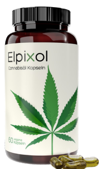
Elpixol® Cannabisöl Kapseln 60 St. PZN: 17902764 UVP: 29,95 €