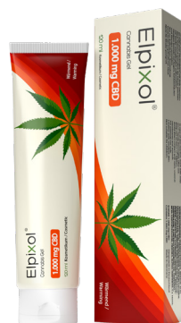
Elpixol® Cannabis Gel 1.000 mg CBD – wärmend PZN: 19273545 UVP: 24,90 €