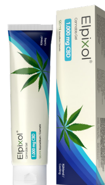
Elpixol® Cannabis Gel 1.000 mg CBD – kühlend PZN: 19273551 UVP: 24,90 €