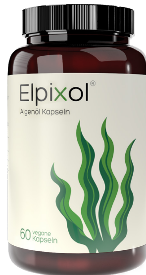
Elpixol Algenöl Kapseln Inhalt: 60 Stk. PZN: 18759530