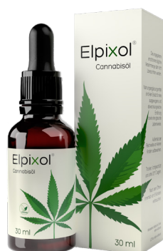
Elpixol® Cannabisöl Tropfen 30 ml PZN: 16612544 UVP: 39,99 €