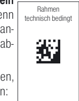
Rahmen technisch bedingt